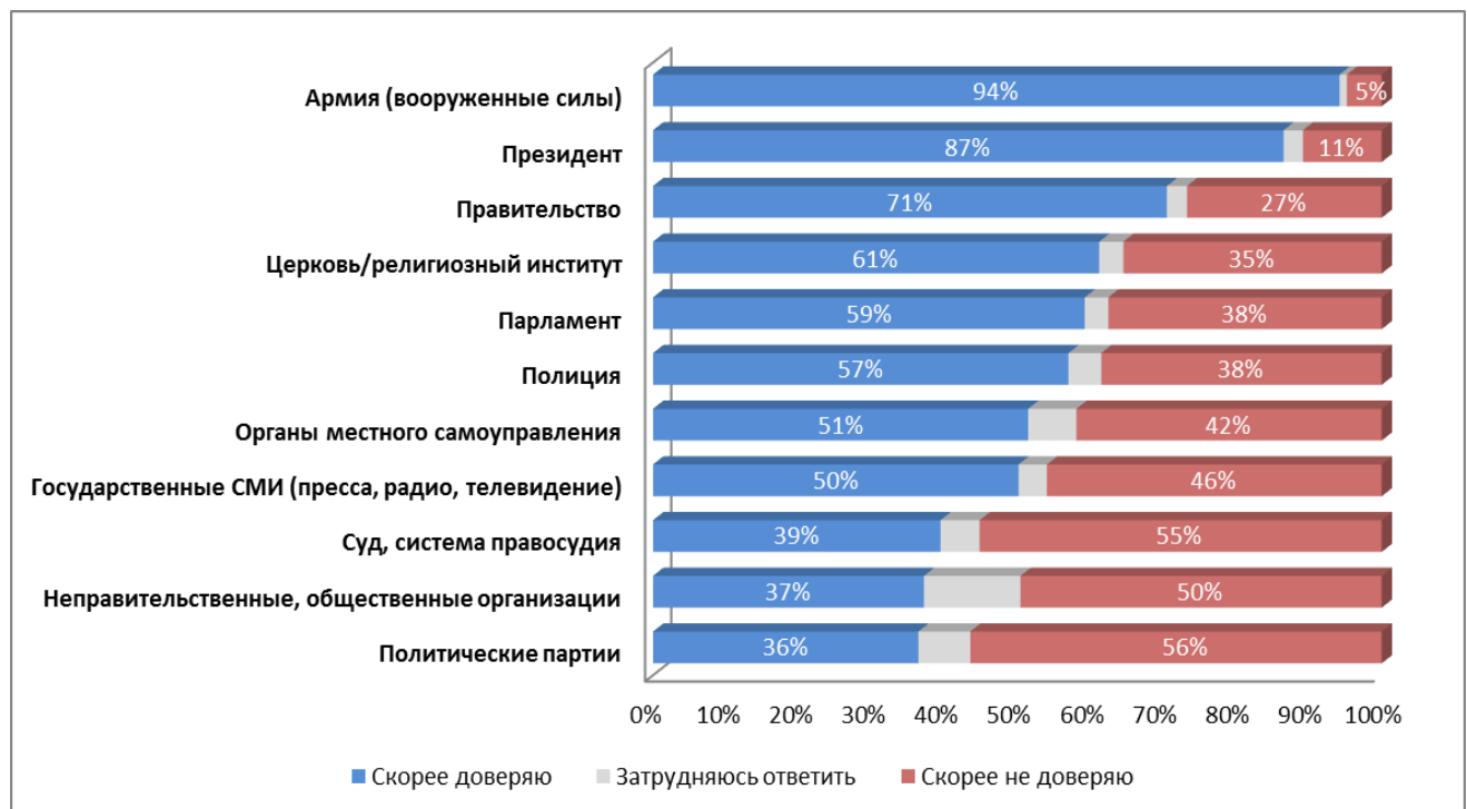
Рисунок 3.1-1. Скажите, насколько Вы доверяете каждому из перечисленных институтов - полностью доверяете, в некоторой степени доверяете, не очень доверяете или совсем не доверяете? (в % от всех респондентов)

Сравнение доверия к социальным институтам в Армении, Грузии и России, представленное в таблице 3.1-2, демонстрирует характерную особенность – высокий, в сравнении с другими странами, уровень доверия к правительству. Можно предположить, что подобная разница в уровне доверия берет свое начало в недавнем обновлении состава правительства в Армении и скорее носит характер «аванса».